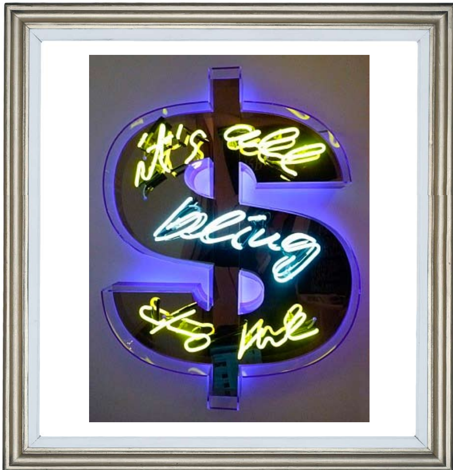
It's All Bling To Me*