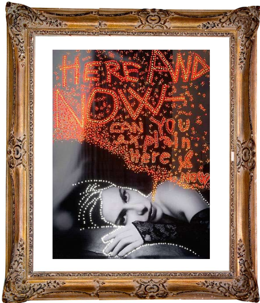
Here and now - can you explain here&now*

«ПРЕМИЯ КАНДИНСКОГО» — самая крупная независимая премия в области современного искусства России, которая была учреждена Культурным Фондом «Артхроника» в 2007 году.