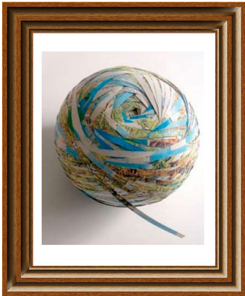
Map of the World*