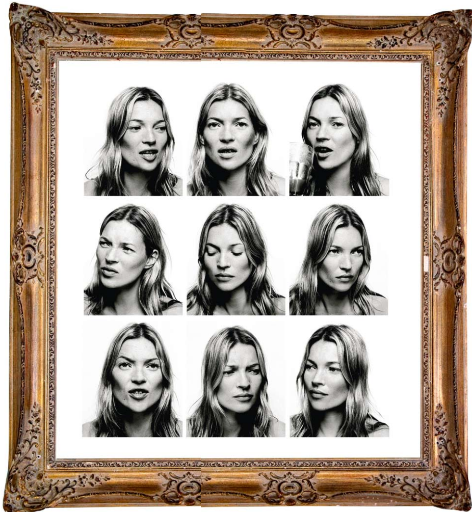
Portraying Kate Moss*

НАШИ ЧИТАТЕЛИ — УНИКАЛЬНАЯ АУДИТОРИЯ ЛЮБИТЕЛЕЙ ИСКУССТВА, ИНВЕСТИРОВ И КОЛЛЕКЦИОНЕРОВ. Это думающие люди, открытые всему новому и принимающие самостоятельные решения.